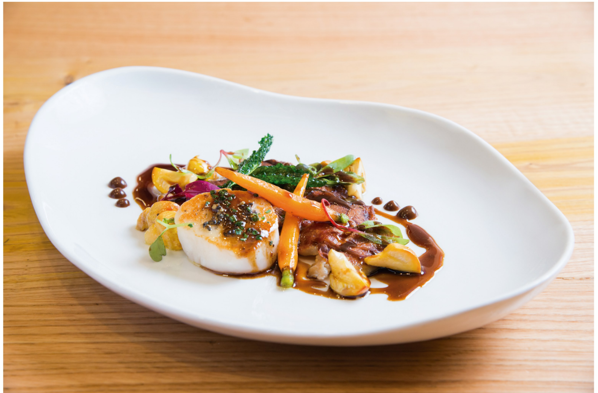
Plate the pork and scallops and then place mushrooms and sautéed carrots around. Garnish with fermented garlic, sprouts and extra virgin olive oil.