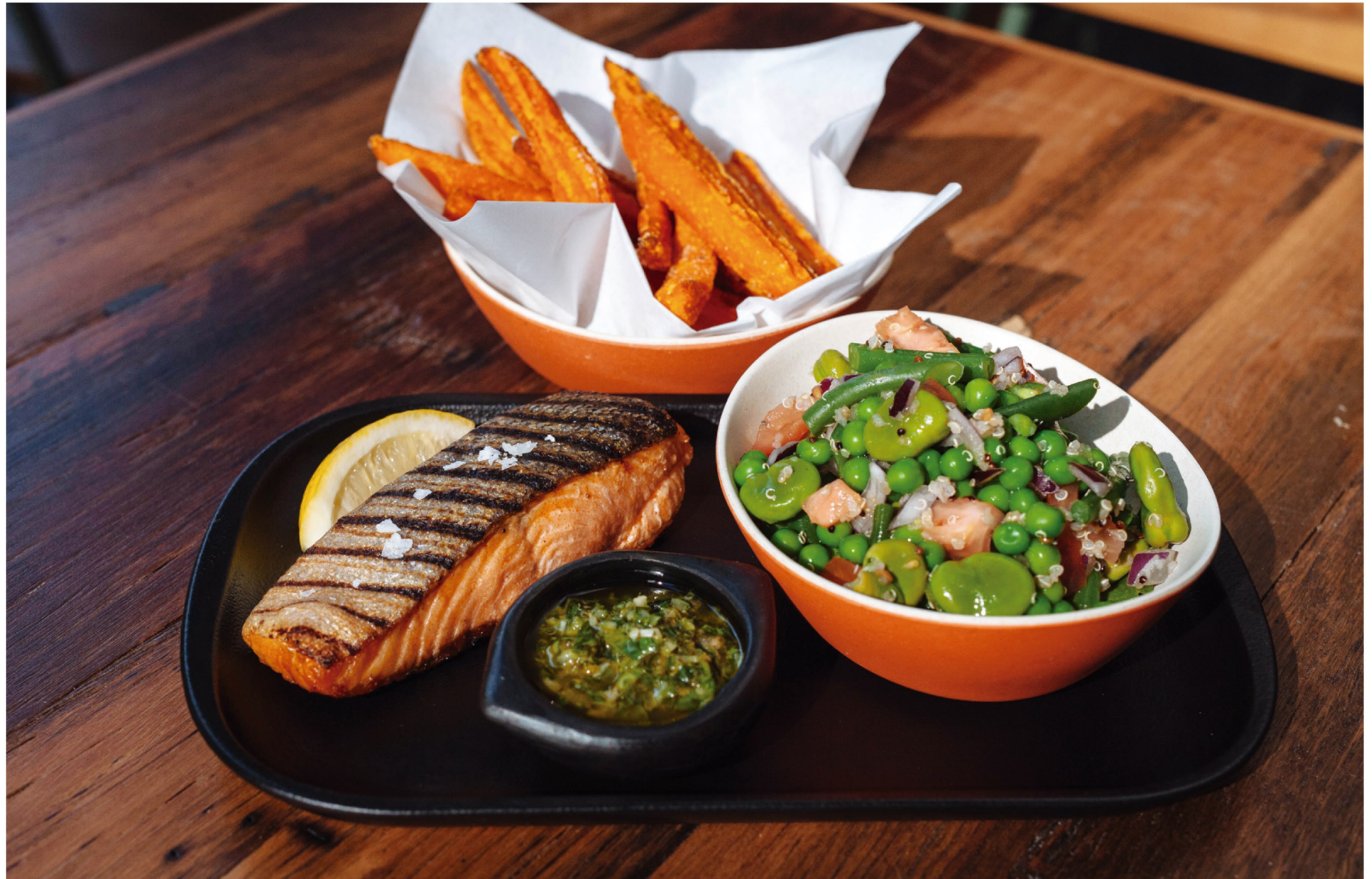
Plate the grilled salmon on an iron skillet accompanied with a wedge of lemon. Dress with 3 tablespoons of the salad dressing or separately in a side dish. Serve the mixed bean salad in a side bowl and the potato wedges in another.